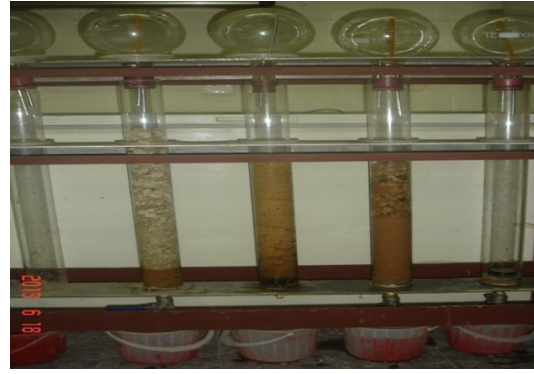
شكل (2) منظومة الاعمدة.

النتائج الموضحة في جدول (5) تبين تأثير الاضافة لمعاملات الري في النمو الخضري للشتلات ونمو الأطوال إذ أكدت النتائج وجود زيادة معنوية في النمو الخضري والاطوال للنبات لإضافة المياه الخام لوحدها وكذلك عند إضافة المياه الرمادية المعالجة (المعاملة الثانية) بالمقارنة بمعاملة المياه الرمادية غير المعالجة لوحدها. واتفقت النتائج مع حصل عليه من نتائج الباحثين الذين حصلوا على زيادة في نمو النباتات المروية بمستويات مختلفة من المياه العادمة (عزيز، 1995 والحديثي، 2002 والحديثي، 2011). كما أظهرت النتائج المبينة في جدول (5) وجود زيادة معنوية في كمية العناصر الممتصة من قبل النبات عند اضافة المياه الرمادية لوحدها وكذلك عند إضافة المياه الرمادية المعالجة (المعاملة الثانية) مقارنة بمعاملة المياه الخام (المعاملة الثالثة)، وتعزى تلك الزيادة لاحتواء المياه الرمادية كميات لا بأس بها من العناصر الثقيلة أكثر لما موجود في المياه الخام وبالتالي زيادة الكميات الممتصة للعناصر من قبل النبات عند الاضافة للمياه الرمادية.