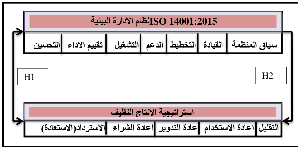
شكل (1) المخطط الفرضي للبحث

يبني المخطط الفرضي للبحث في ضوء مضامين مشكلة البحث واهدافه يوضح حركة المتغيرات المستقلة والمعتمدة (التابعة) وكما في الشكل الاتي :-