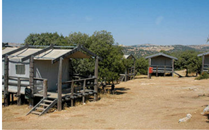
صورة رقم (6) نموذج الخيام في المحمية

تحديداً، وذلك بزيادة المنافع الاقتصادية والاجتماعية لسكانها وتحسين نوعية حياتهم. وقد قامت إدارة المحمية بإنشاء العديد من المشاريع والأنشطة التنموية في هذه القرى، بهدف مساعدة السكان اقتصادياً واجتماعياً، وللإطلاع على الآثار التنموية لهذه المحمية على المجتمع المحلي قام الباحث بإجراء العديد من الزيارات الميدانية للمحمية والقرى المجاورة، وأجرى العديد من المقابلات الشخصية مع المسؤولين في المحمية وسكان هذه القرى الذين طالبتهم المنافع الاقتصادية أو الاجتماعية، ومن خلال هذه الزيارات والمقابلات تم حصر هذه الآثار على النحو التالي: