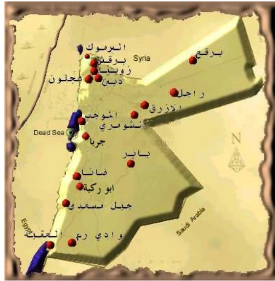
خريطة رقم (2) المحميات الطبيعية في الأردن