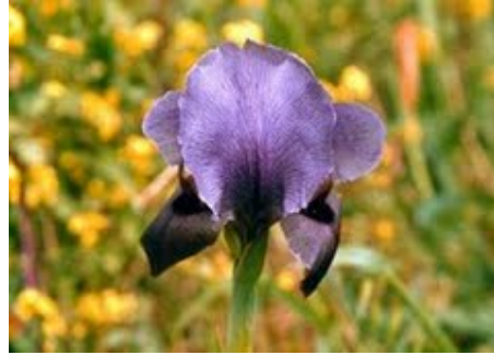
صورة رقم (2) السوسنة السوداء