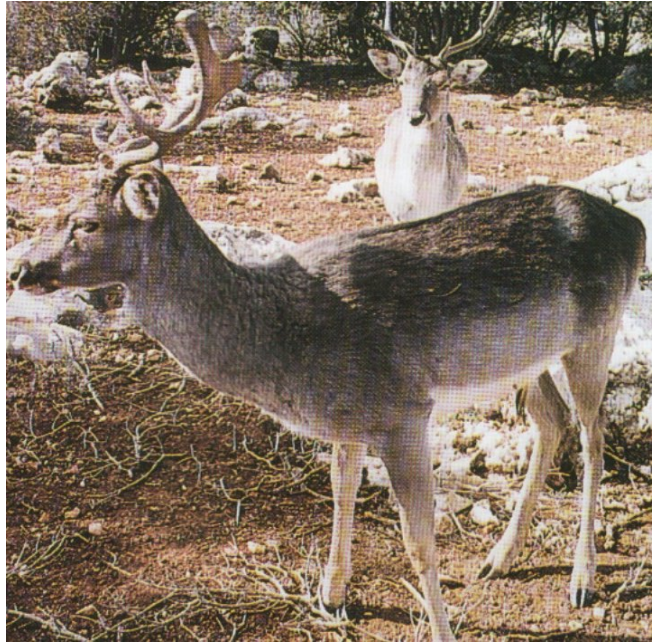
صورة رقم (3) الأيل الأسمر

على اتفاقية السابيتس (37) ، من أهمها الأوركيد الهرمي وبخور مريم من النباتات والسنجاب والقط البري والحرباء من الحيوانات.