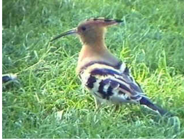
صورة رقم (4) طير الهدهد من الطيور الشائعة في المحمية

أ. على المستوى الحيواني : حماية وإكثار الأييل الأسمر Roe deer وقد انقرض هذا الحيوان من الأردن في الستينيات من القرن الماضي ، وقد أعادت الجمعية الملكية لحماية الطبيعة الأييل