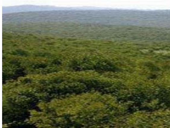
صورة رقم (1) منظر عام لغابات البلوط في المحمية

- الغطاء النباتي: يُغطّي أرض المحمية غطاء نباتي كثيف يتكوّن في أغلبه من غابات شجر البلوط الدائم الخضرة (Ever green forest) (صورة رقم 1) وفي المحمية أنواع أخرى من الأشجار