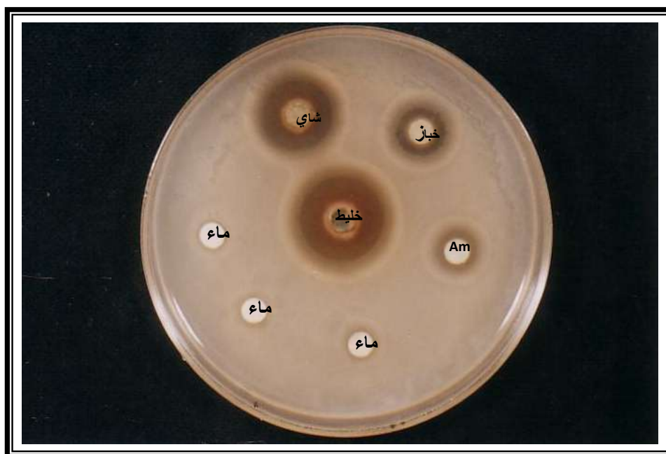
شكل ( 1 ) : يبين حساسية بكتريا Escherichia coli المسببة للإسهال لتراكيز المستخلصات 1000 ملغم/مل