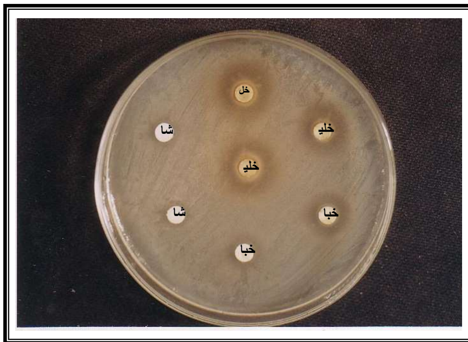
شكل ( 2 ): يبين حساسية بكتريا Salmonellae لتركيز 1000 ملغم/مل من المستخلصات النباتية بدليل قطرة الدائرة المثبطة (ملم) .